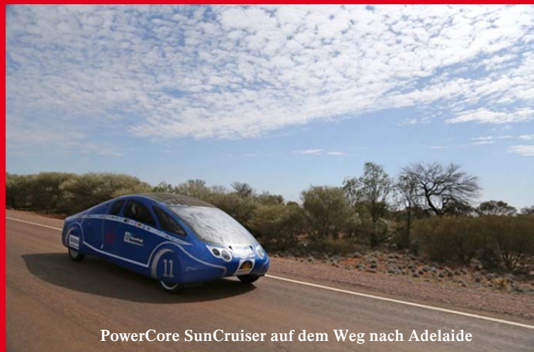
PowerCore SunCruiser auf dem Weg nach Adelaide