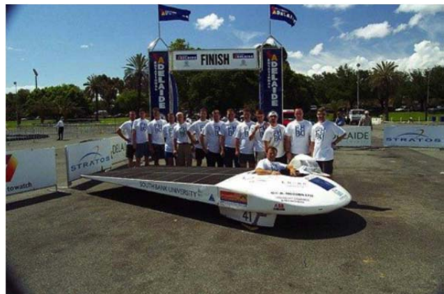
Das Team um Mad Dog III im Ziel in Adelaide

Neben den Erfolgen beim Rennen belegt auch die Auszeichnung mit dem Technical Innovation Award, den das Team für das im Auto verbaute Bluetooth-Telemetrie-system erhält, wie hoch der Entwicklungsstandard im Team war und ist.