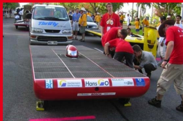
Hans Go! beim Boxenstopp