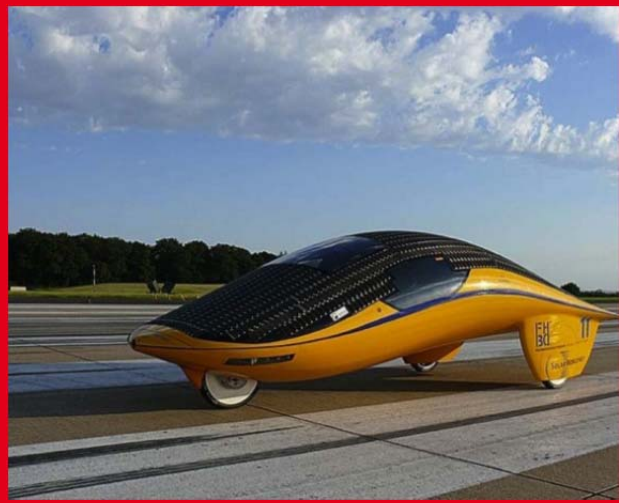
Zu Recht das schönste SolarCar der Welt