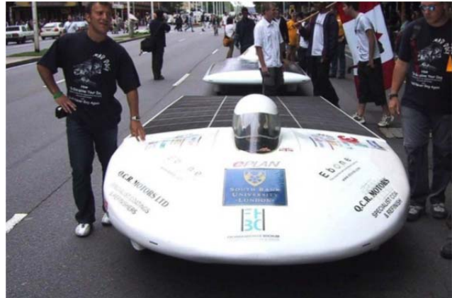
Mad Dog III

Seitdem entwickeln Studierende der Hochschule alle zwei Jahre ein Auto, das ausschließlich von der Energie der Sonne angetrieben wird. Es fährt völlig autark, ohne auf eine Stromspeisung oder die Verbrennung fossiler Stoffe angewiesen zu sein.