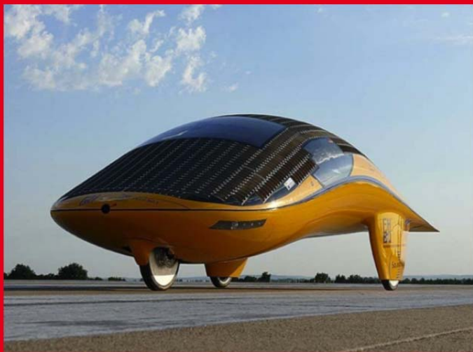
SolarWorld No. 1

Durch seine Auszeichnung als „Schönstes SolarCar der Welt“ und durch seine mustergültige Energieeffizienz wird der „SolarWorld No. 1“ zum Stolz des ganzen Teams - sowohl auf Seiten der Professoren und Mitarbeiter als auch bei den studentischen Teammitgliedern.