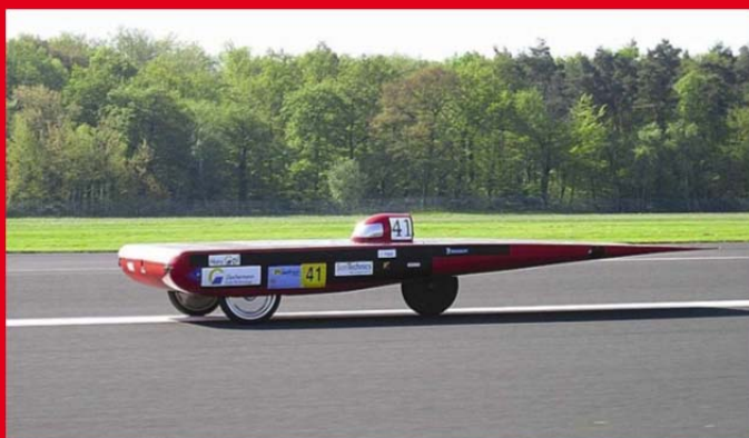
In Aktion: Hans Go! in voller Fahrt