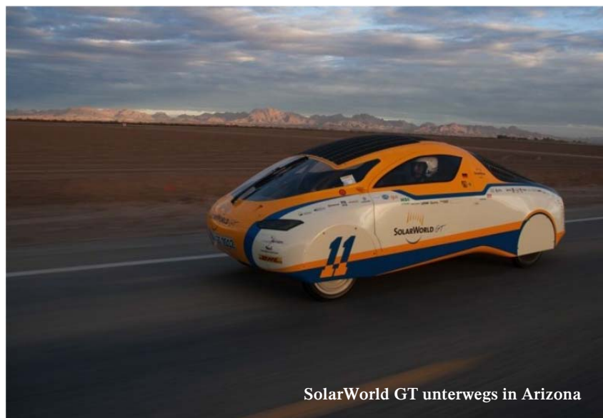
SolarWorld GT unterwegs in Arizona