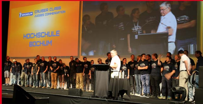
Das gesamte Team nimmt in Adelaide den Jurypreis entgegen

Bei der Preisverleihung in Adelaide wurde dem Team außerdem der Preis „Jury Commendation“ verliehen. Dieser Preis wird an das SolarCar vergeben, das nach Meinung der Jury am besten für den Gebrauch im Alltag geeignet ist und gleichzeitig durch ein herausragendes Design besticht.